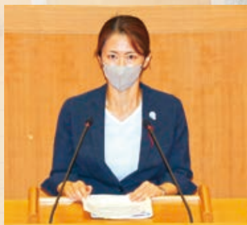
▲9月21日 代表質問の様子