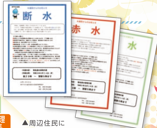
▲周辺住民に配布されたお知らせ文書