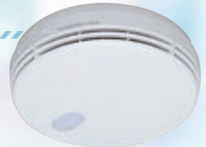
▲連動型住宅用火災警報器