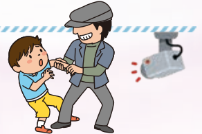
市内特別支援学校の自力通学者